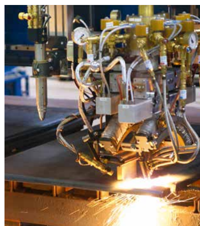
Dreibrenneraggregat D/AFL Triple bevel head D/AFL