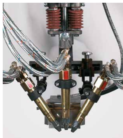
Dreibrenneraggregat N Triple bevel head N